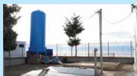
Impianti i Trajtimit të Ujit të Ndotur, Lezhë