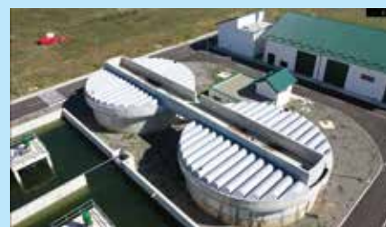
Impianti i Trajtimit të Ujit të Ndotur, Prizren